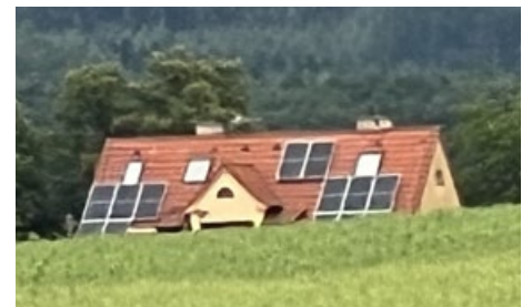
Když je vůle, jde to všude